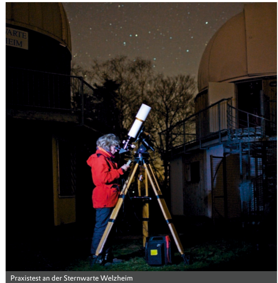
Praxistest an der Sternwarte Welzheim

Leider lässt sich der Auszug nicht so weit einfahren, dass ich mit meinem Baader-Großfeld-Binokularansatz ohne brennweitenverlängernde Linsen den Fokus treffe. Umgekehrt ist er auch nicht weit genug herausfahrbar, um mit einer angeschlossenen Kamera ein scharfes Bild zu erhalten. Dazu ist eine Verlängerungshülse notwendig.